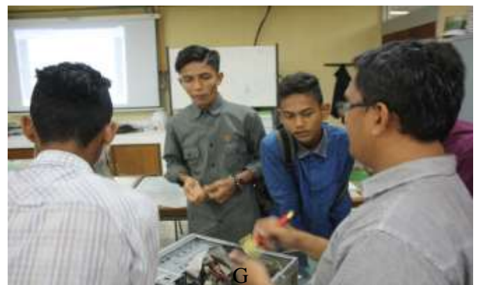
Gambar 2.2 Peserta membersihkan dan memasang RAM

baik mengenai perakitan komputer dan melakukan instalasi komputer. Metode ini digunakan untuk mengetahui sejauhmana tiap peserta mampu melakukan perakitan komputer dan instalasi komputer. Peserta pelatihan sedang melakukan praktek seperti yang terdapat pada gambar 2.1, gambar 2.2 dan gambar 2.3.