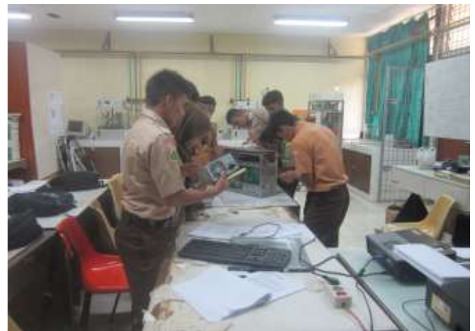
Gambar 2.1 Peserta pelatihan membongkar PC

Pada metode ini peserta mempraktikkan langsung semua materi yang sudah didapatkan sebelumnya